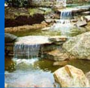
Nourriture / eau